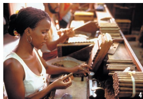
(1) Havannas Altstadt. (2) Che-Guevara-Doppelgänger posieren gern für Fotografen. (3) Bodeguita del Medio: Mit einem Mojito auf den Spuren Hemingways. (4) Zigarrenhandwerk: Fabrica La Corona

Ein absolutes Muss ist der Besuch von verschiedenen Bars in der kubanischen Hauptstadt, wo